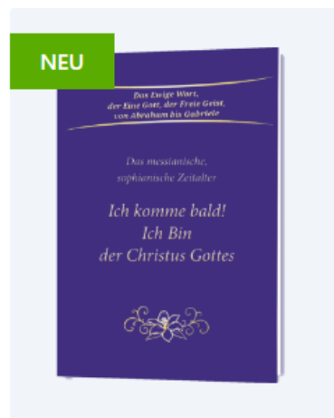
Ich komme bald! Ich Bin der Christus Gottes