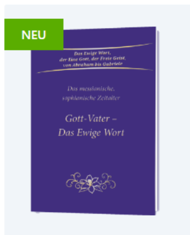
Gott-Vater – Das Ewige Wort (Taschenbuch)