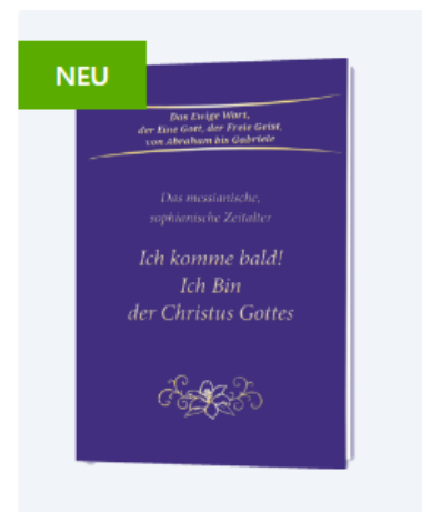
Ich komme bald! Ich Bin der Christus Gottes

WHO-Pandemievertrag: Angriff auf Ihre Freiheit.