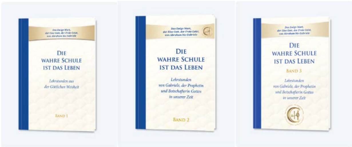
Die wahre Schule ist das Leben – Band 1